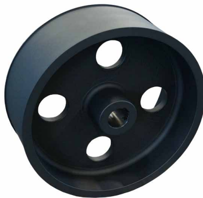
Ballige oder dachballige Ausführung der Lauffläche. Optional mit Gurtführung durch Bordränder an den Außenkanten.