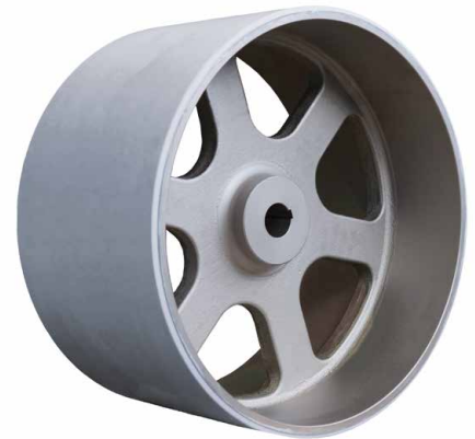
Gurtscheibe mit galvanisch vernickelter Oberfläche zur Verwendung in der lebensmittelverarbeitenden Industrie.